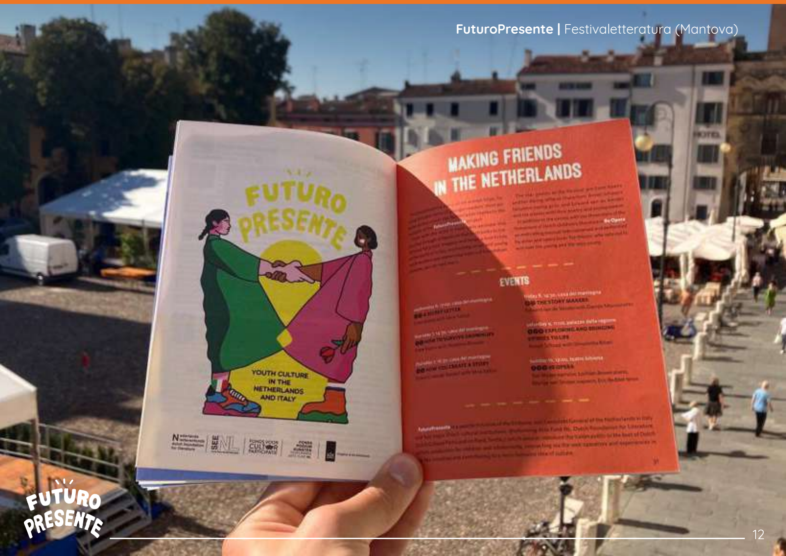
FuturoPresente | Festaletteratura (Mantova)

Netherlands Ministerie van Buitenlandse Zaken Ministerie van Cultuur en Media Ministerie van Onderwijs, Wetenschap en Sport