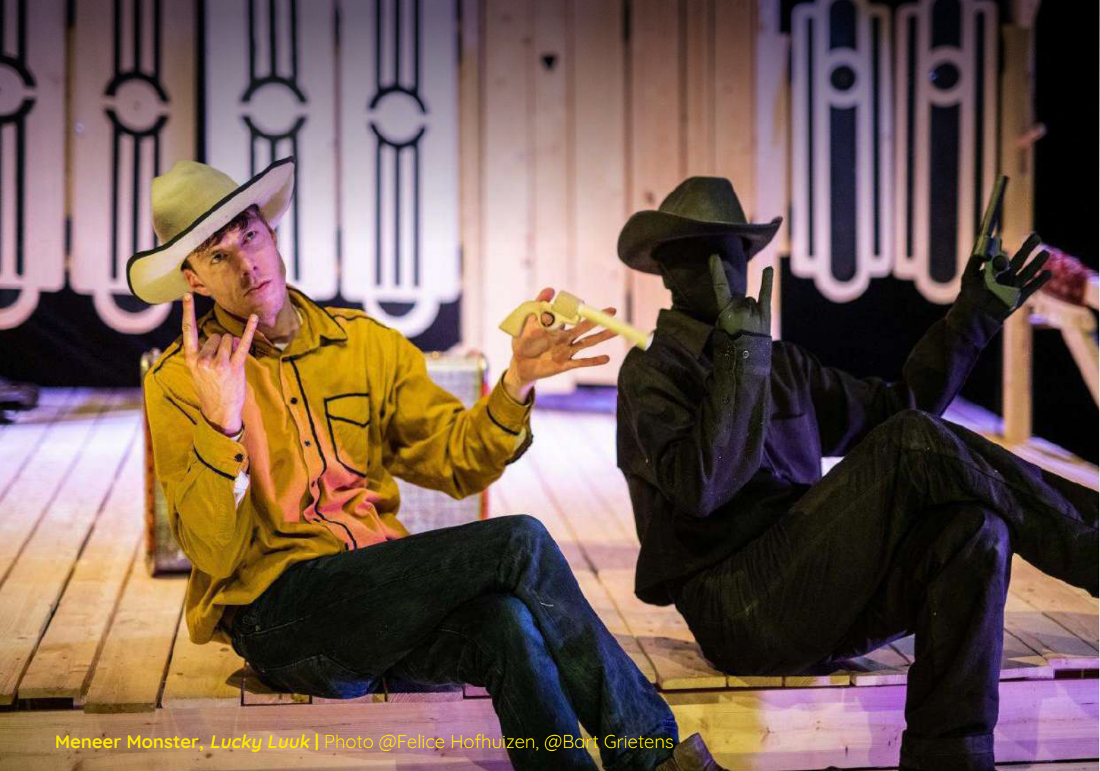
Meneer Monster, Lucky Luuk