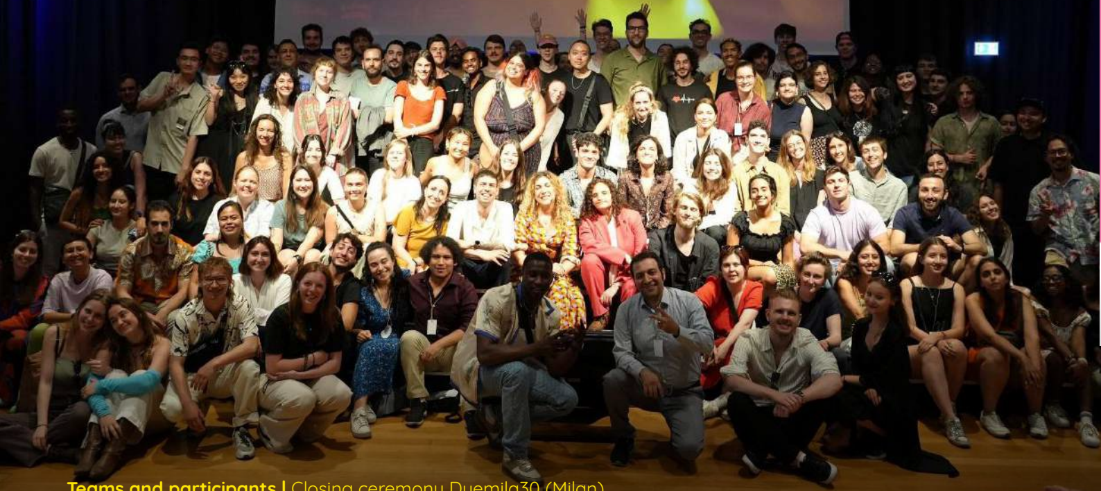
Teams and participants | Closing ceremony Duemila30 (Milan)