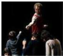
«Hermit» - Simone de Jong

È il travolgente spettacolo «Hermit» della compagnia olandese Simone de Jong, ospite eccezionale della programmazione «Primi sguardi» dedicato ai bimbi (dagli 1 ai 6 anni) e parte di un cartellone ben più vasto del Festival internazionale destagionalizzato «Trame» organizzato dal Teatro Telaio.