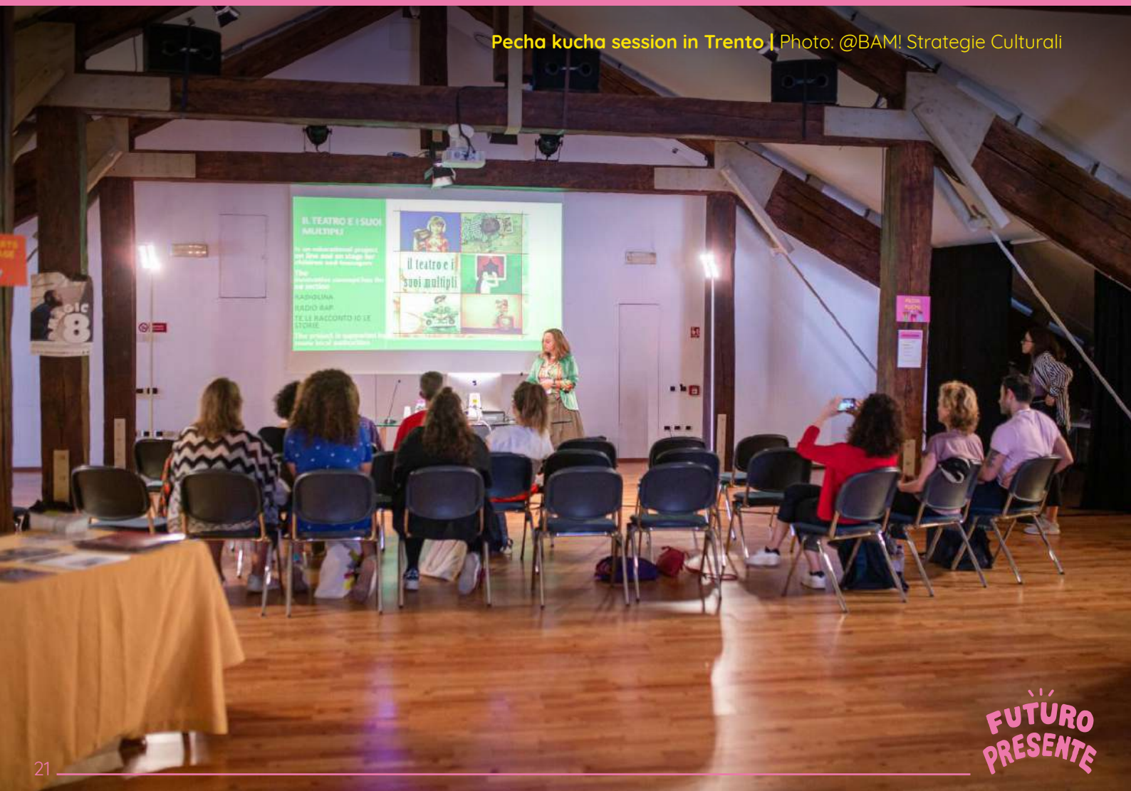
Pecha kucha session in Trento | Photo: @BAM! Strategie Culturali