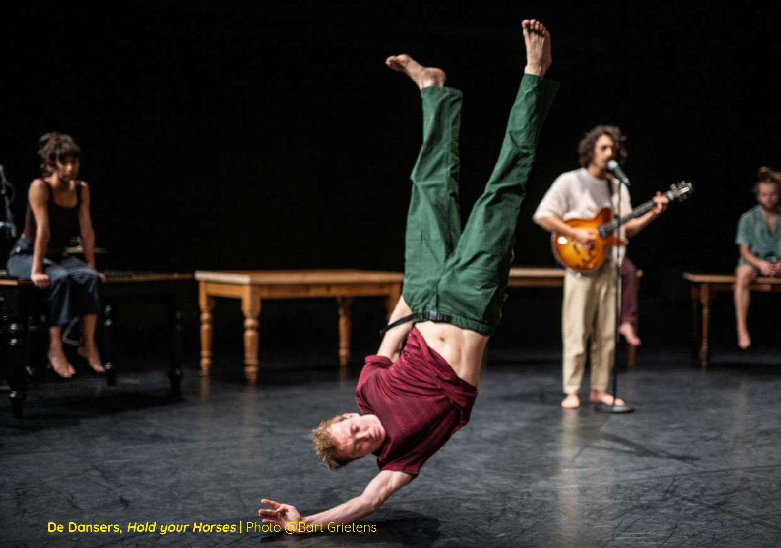
De Dansers, Hold your Horses