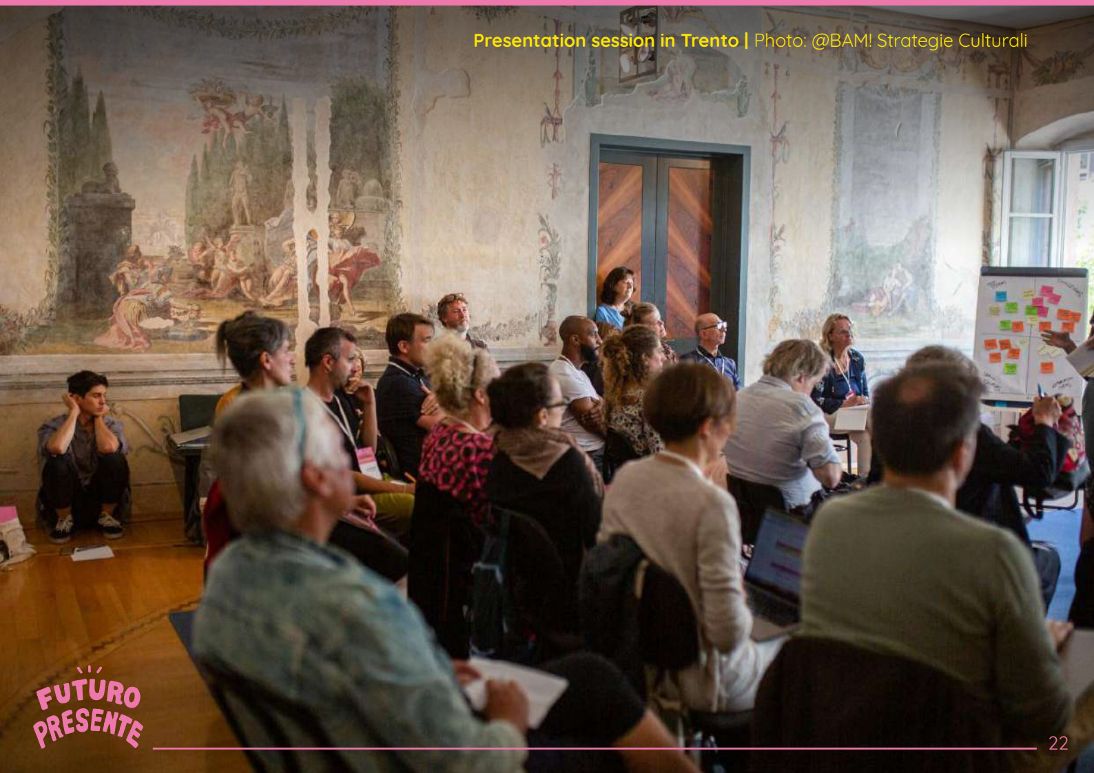
Presentation session in Trento