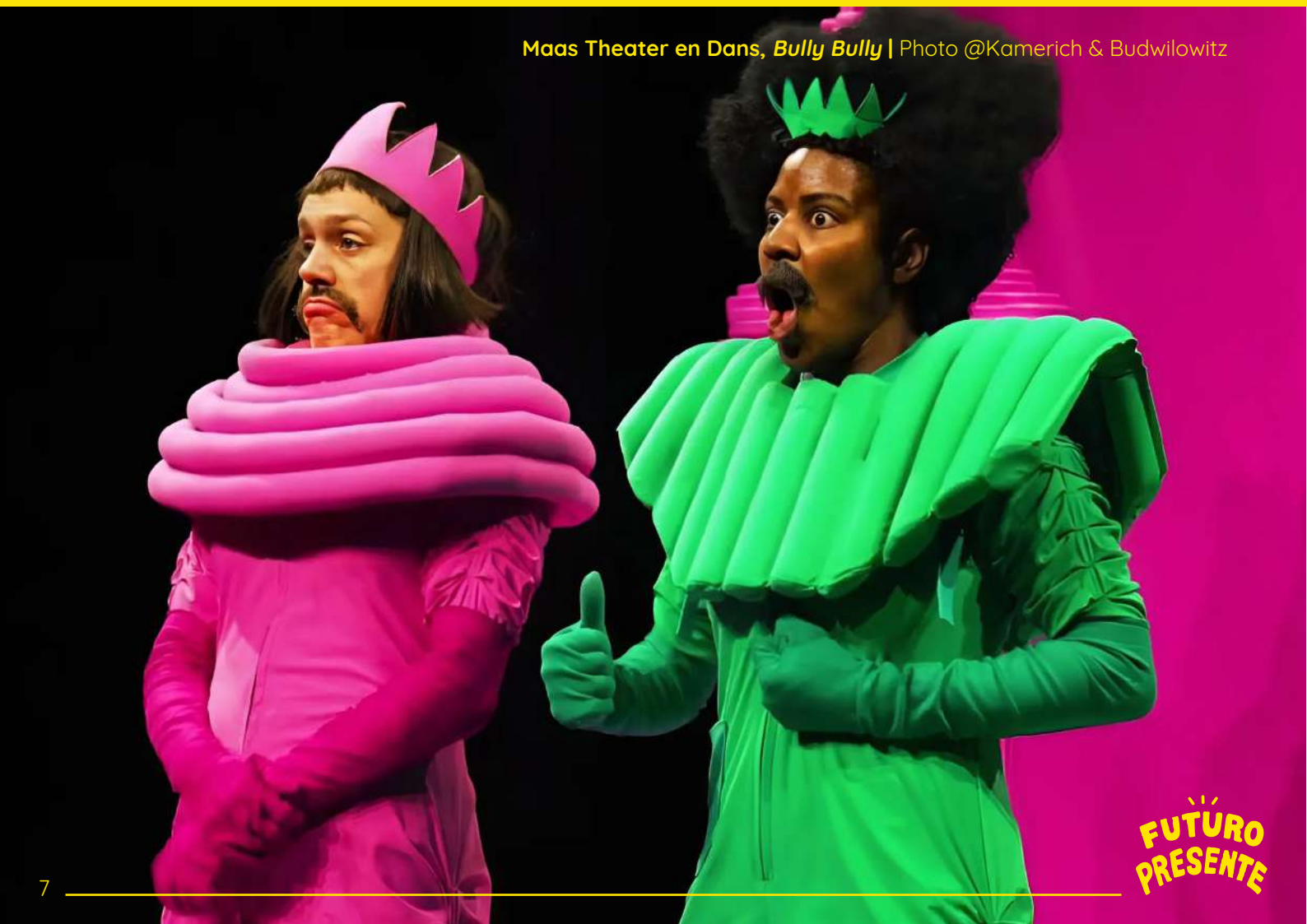
Maas Theater en Dans, Bully Bully