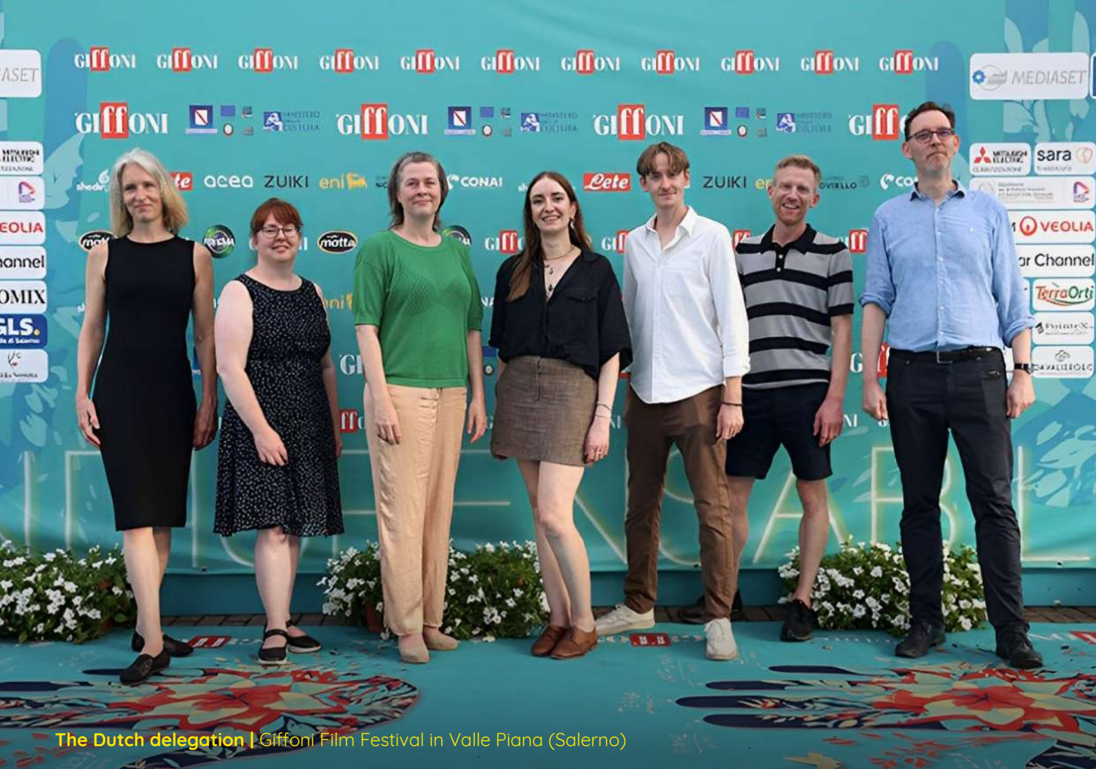
The Dutch delegation | Giffoni Film Festival in Valle Piana (Salerno)