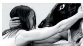
▲ Hold Your Horses

"Hold Your Horses", idioma inglese mutuato dal mondo dell'equitazione che sta per "rallenta", parla dell'impulso di aggrapparsi a qualcosa o qualcuno. «Dopo 18 mesi di distanza, quando anche una stretta di mano era sospetta, qual-