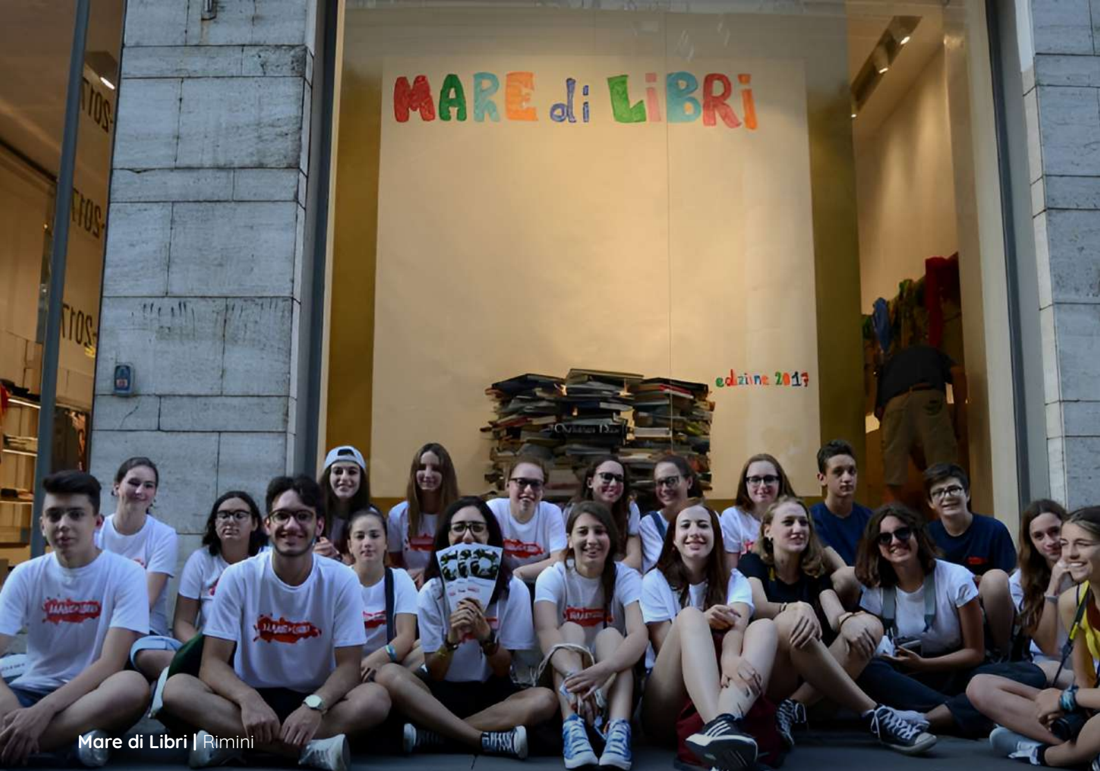
Mare di Libri | Rimini