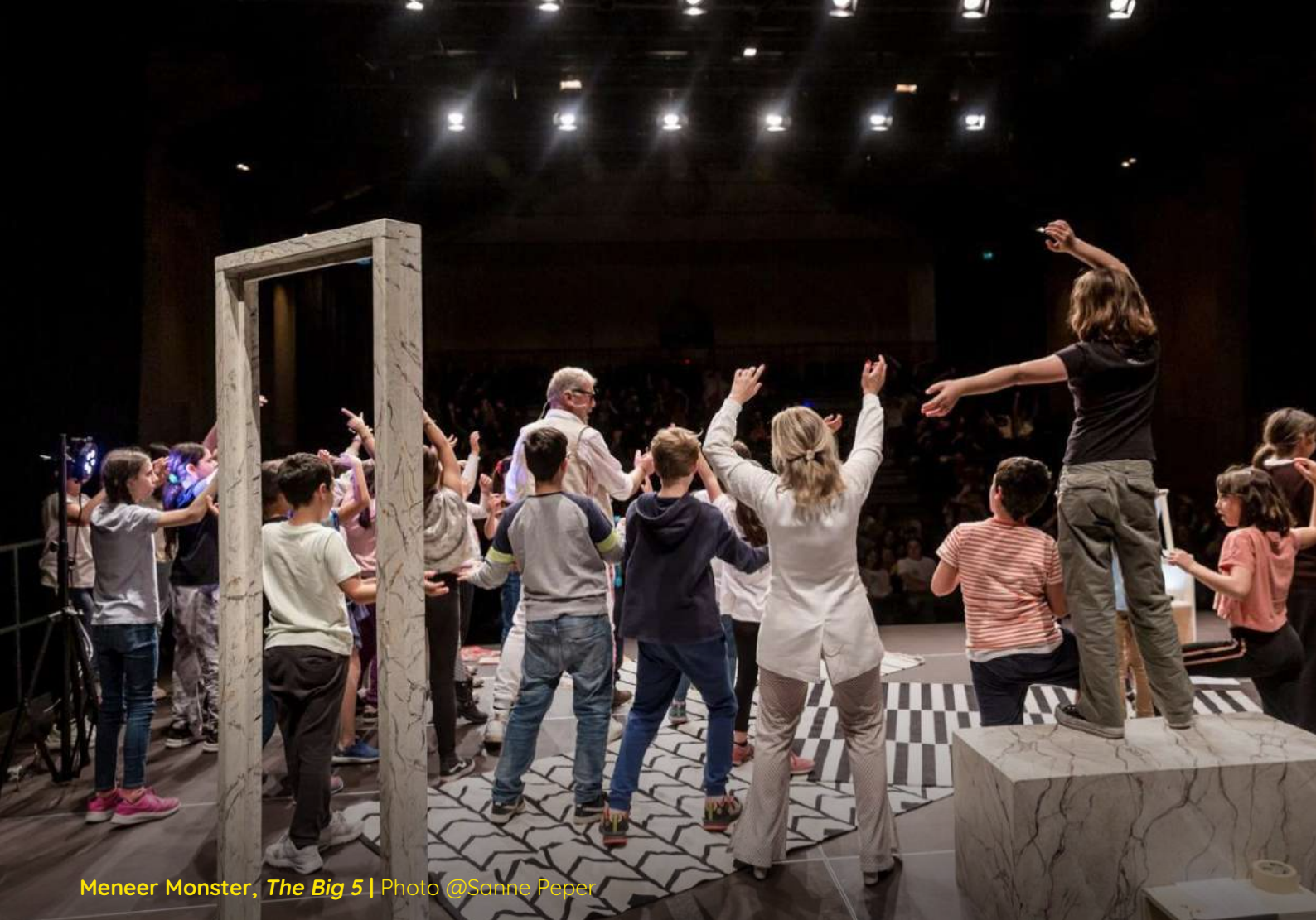
Meneer Monster, The Big 5