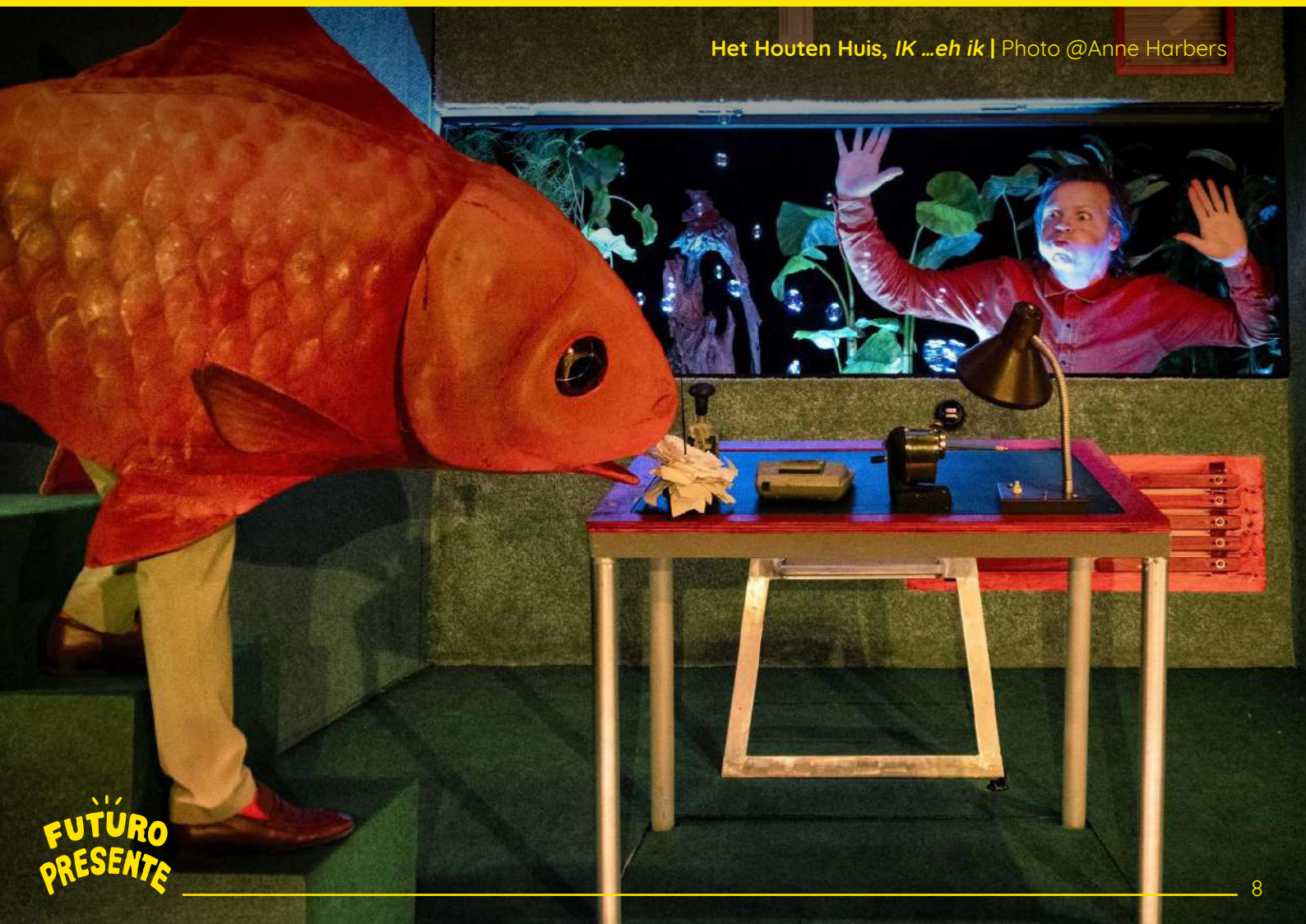
Het Houten Huis, IK ...eh ik